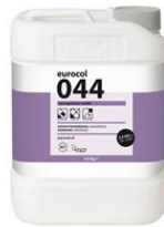
Verpakking 2,5 kg