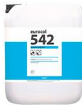
Verpakking 5 kg