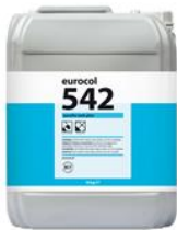
Verpakking 10 kg

Artikel Omschrijving Verpakking EAN-code 542 Eurofix Tack Plus Can à 10 kg 8 710345 542104