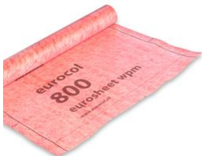
Colis 10m2 uitgerok