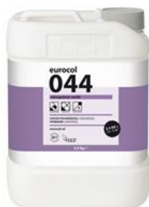
Colis 2,5 kg