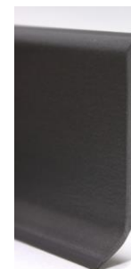
0146 Gris foncé