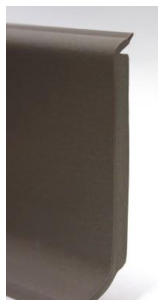
4005 Taupe clair