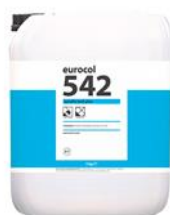
Verpakking 5 kg