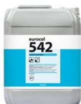
Verpakking 10 kg

542 Eurofix Tack Plus Can à 10 kg 8 710345 542104