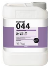
Colis 2,5 kg