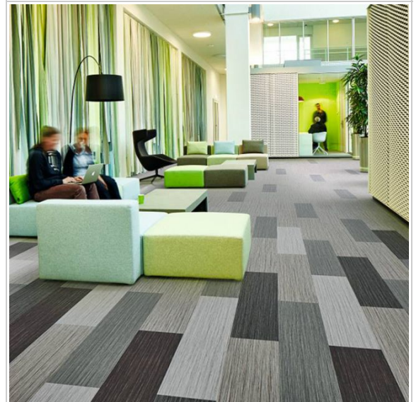
Flotex Planks | Seagrass

Auch in punkto Komfort lässt diese Textilkonstruktion keine Wünsche offen. Der dichte Flor ist angenehm im Auftritt, dabei extrem robust. Die einzelnen Fasern sind fest in der Rückenkonstruktion verankert, richten sich nach dem Begehen immer wieder auf und kehren in ihre Ausgangsposition zurück. Mit einem Trittschallverbesserungsmaß von 19 dB minimiert Flotex den Raumschall merklich und empfiehlt sich so auch als tolle Akustiklösung.