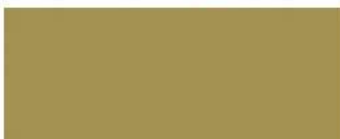
1159 - or métallisé