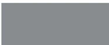
1168- aluminium métallisé