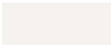
1013 - blanc