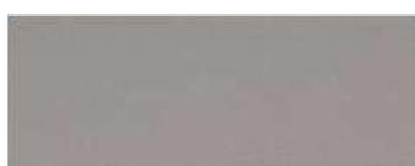
1246 - platine