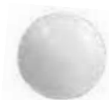
Réf 3470ADH Blanc