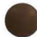
Réf 3477ADH Marron