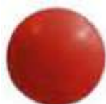
Réf 3473ADH Rouge