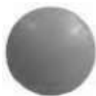
Réf 3471ADH Gris clair