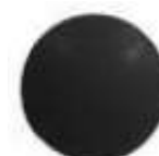
Réf 3478ADH Noir