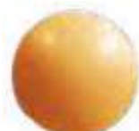
Réf 3476ADH Jaune