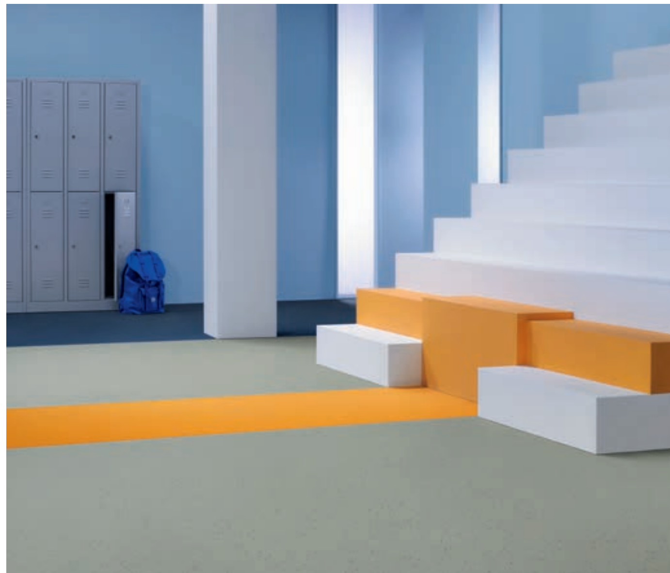
50207 | denim 50210 | mandarin 51212 | vivid elephant