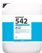
Verpakking 5 kg