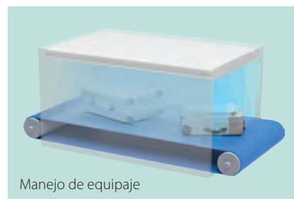
Manejo de equipaje