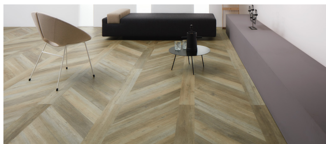
Układanie wzoru Jodełka Francuska opcja 2

Uwaga: Podobnie jak w przypadku każdego wzoru geometrycznego, nierówności lub pofalowania podłoża mogą powodować słabe wiązanie płytek lub desek do podłoża podczas montażu. Jest to szczególnie ważne w przypadku instalowania jodełki francuskiej, gdzie punkty narożne desek muszą się precyzyjnie łączyć. Należy zwrócić szczególną uwagę na przygotowanie podłoża, w celu zachowania należytej równości podłoża (zgodnie ze standardem SR1).