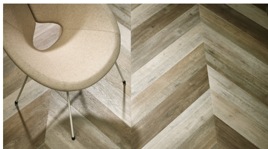
Układanie wzoru Jodełka Francuska opcja 1