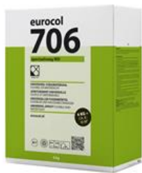
Verpakking 4 kg