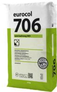
Verpakking 23 kg

De 706 Speciaalvoeg WD is verkrijgbaar in de volgende kleuren: