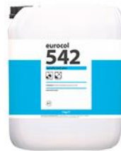
Verpakking 5 kg