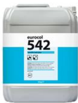
Verpakking 10 kg

542 Eurofix Tack Plus Can à 10 kg 8 710345 542104