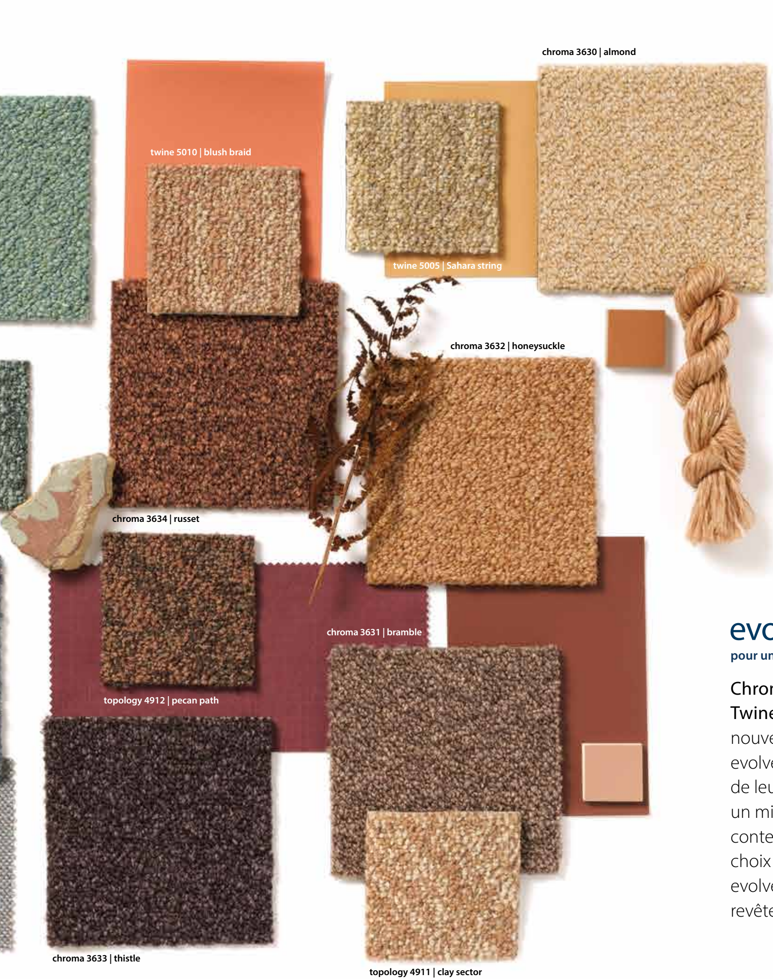
chroma 3630 | almond