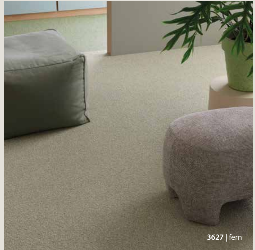
3627 | fern