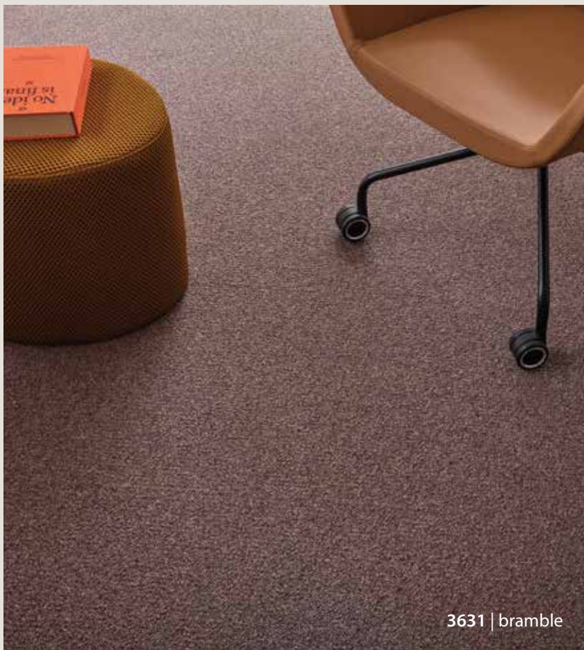
3631 | bramble

Les couleurs, tons et designs de Chroma se coordonnent parfaitement aux autres gammes Tessera et à toutes les collections Forbo Flooring pour des espaces de travail harmonieux.