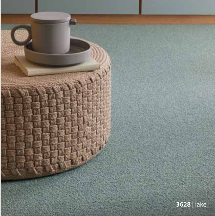
3628 | lake