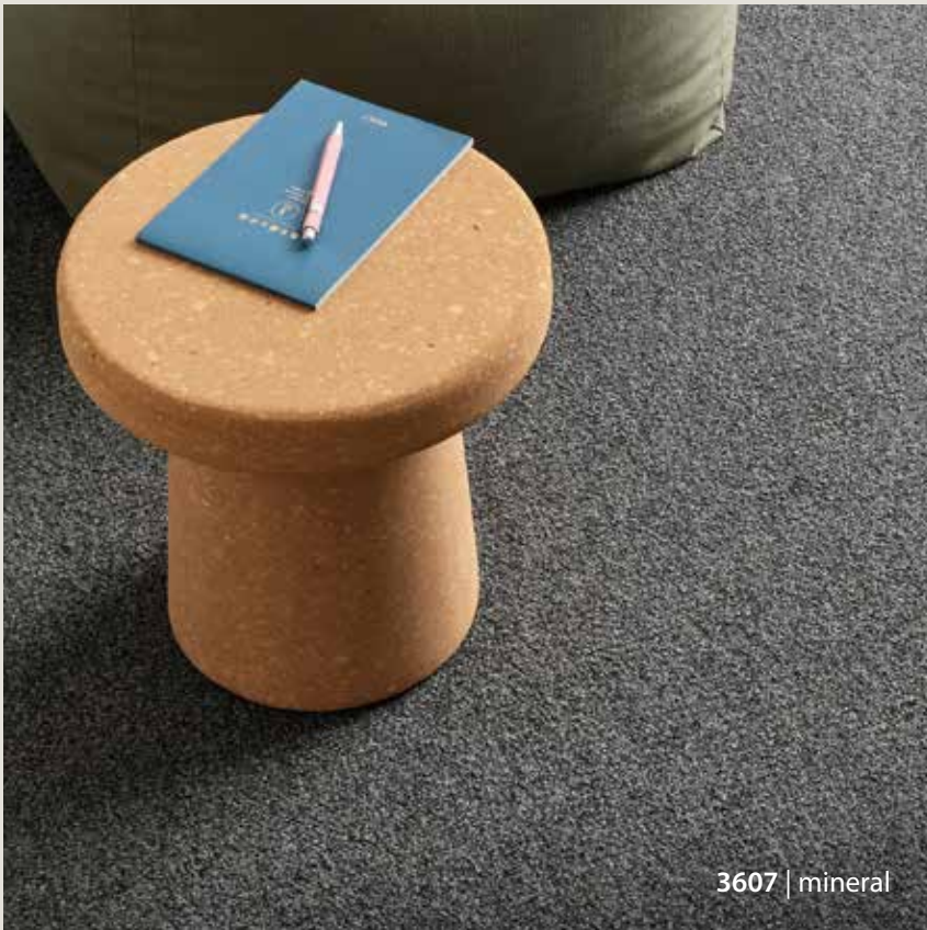
3607 | mineral