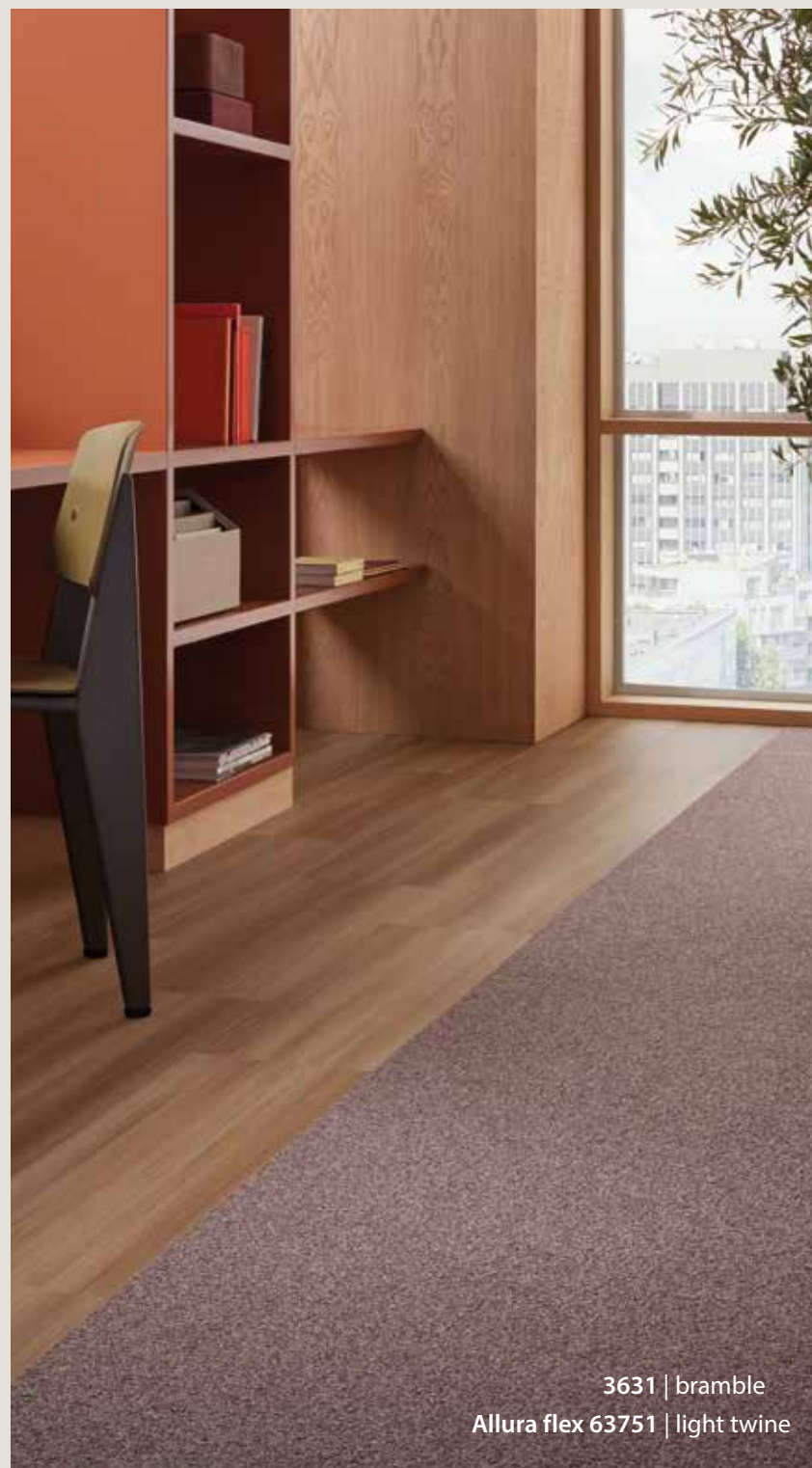
3631 | bramble Allura flex 63751 | light twine

En répondant aux exigences telles que la qualité de l'air intérieur (Indoor Air Comfort et GuT) et aux objectifs de durabilité, la collection Tessera chroma est également conforme aux labels BREEAM, LEED et WELL.