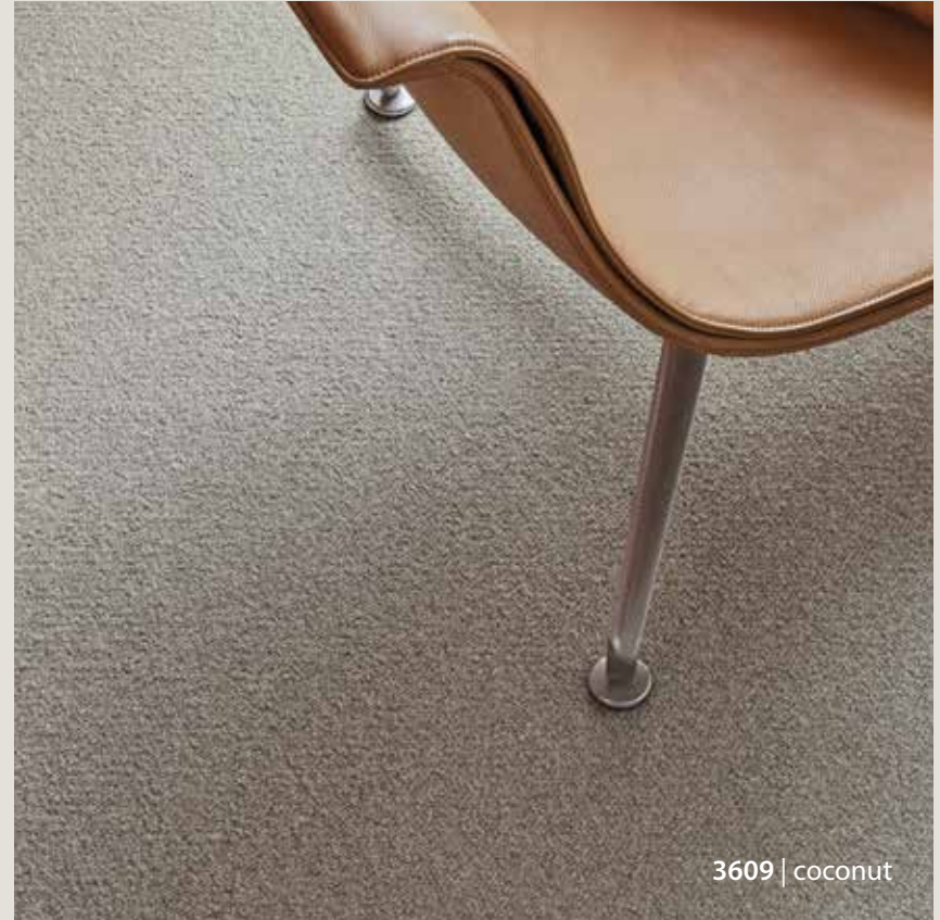
3609 | coconut