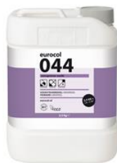
Colis 2,5 kg