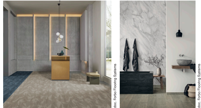
A gauche : Flotex advance latitude linen et latitude tempest A droite : Sarlibain - Sol : Surestep wood grey oak. Mur : Onyx+ marble white et Onyx+ uni ivory

Le textile floqué Flotex next , ensuite, rejoint la famille des solutions en pose 100 % libre , dont Forbo Flooring s'avère leader. En effet, grâce à l'usage de la bande de jonction Modul'up, Flotex bénéficie désormais d'une pose non collée, facile, rapide et économique . A la clé, une réduction des coûts de mise en œuvre et du temps d'immobilisation des locaux 1 , tout en préservant les performances de résistance, durabilité et confort qui font la réputation de la gamme Flotex.