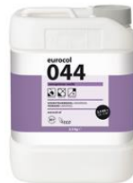
Verpakking 2,5 kg