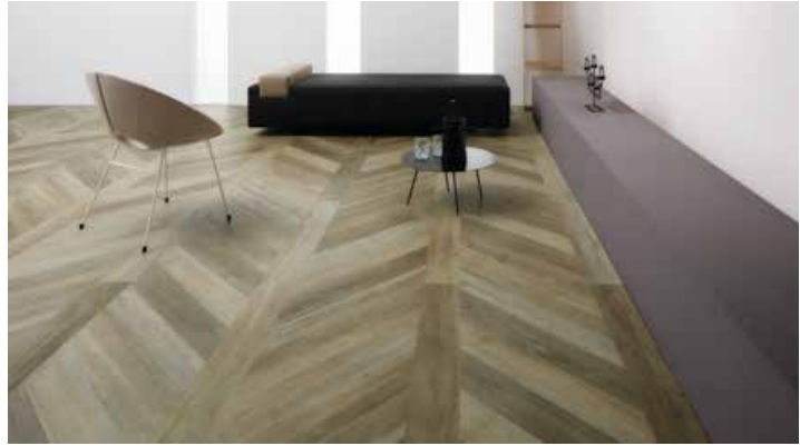
Hungarian Point Laying Option 2

Remarque : Comme pour tout motif géométrique, des irrégularités ou ondulations de la sous-couche peuvent entraîner un décèlement de lames ou planches pendant la pose. Cet aspect est particulièrement important lors de la réalisation d'un point hongrois afin que les extrémités des lames coïncident parfaitement et il convient d'être particulièrement attentif à la préparation de la sous-couche pour garantir le niveau le plus élevé de régularité, à savoir la norme de régularité de surface SR1.