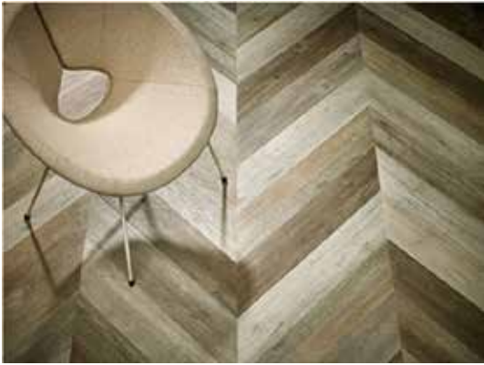
Hungarian Point Laying Option 1