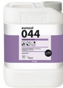
Verpakking 2,5 kg