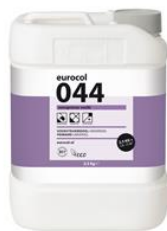
Colis 2,5 kg