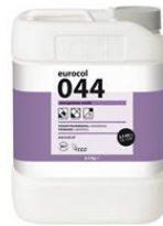
Verpakking 2,5 kg