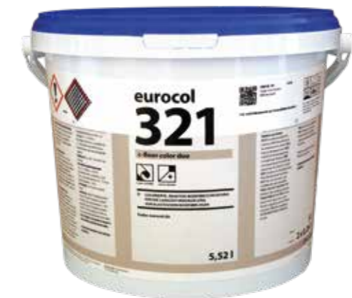
Eurocol 321 CFLOOR Color Duo

Eurocol 321 CFLOOR Color Duo ist verfügbar in verschiedenen Farben. Eurocol 321 CFLOOR Color Duo is available in different colors.