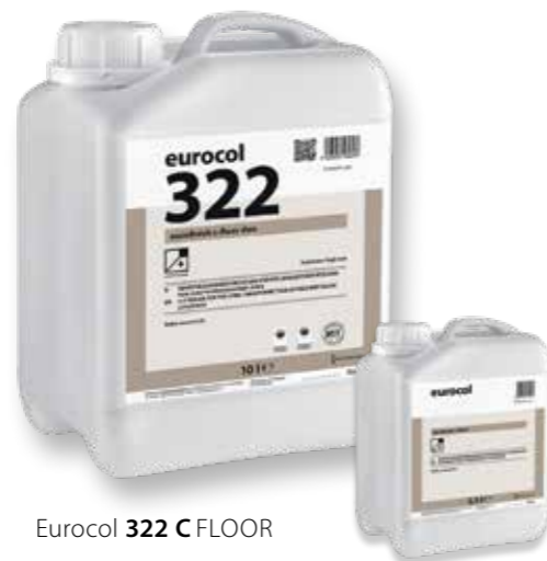
Eurocol 322 C FLOOR