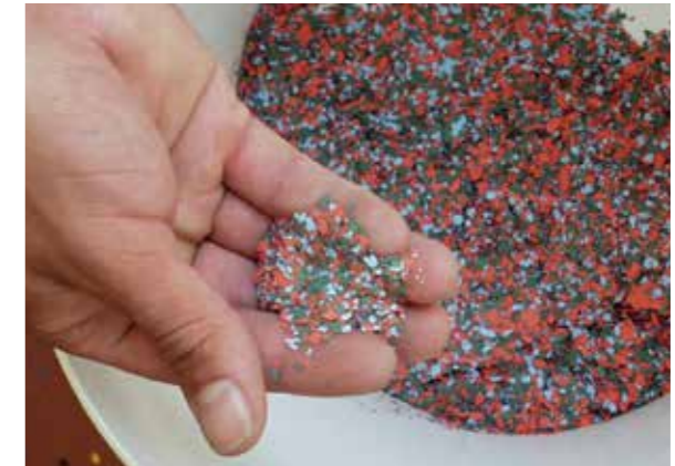
Chip Einstreuung ist in verschiedenen Farbkombinationen möglich. Flakes are available in different color combinations.