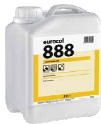
Eurocol 888 EUROCLEAN UNI

For the full maintenance and care instructions, please follow the technical data sheet.