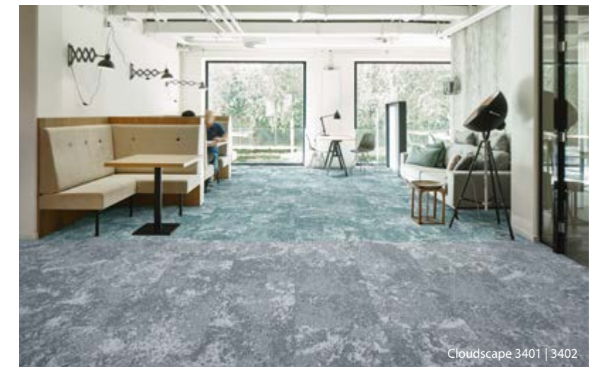
Cloudscape 3401 | 3402