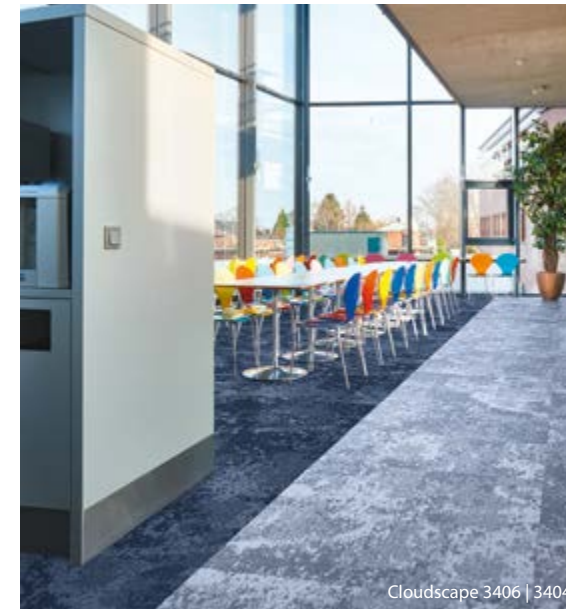
Cloudscape 3406 | 3404