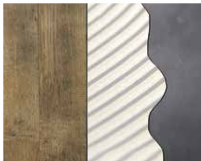
LVT (Designbelag), 628 Eurostar Rapid