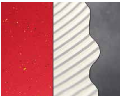
PVC, Elastomerbelag, 628 Eurostar Rapid