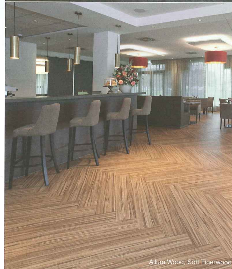
Allura Wood, Soft Tigerwood