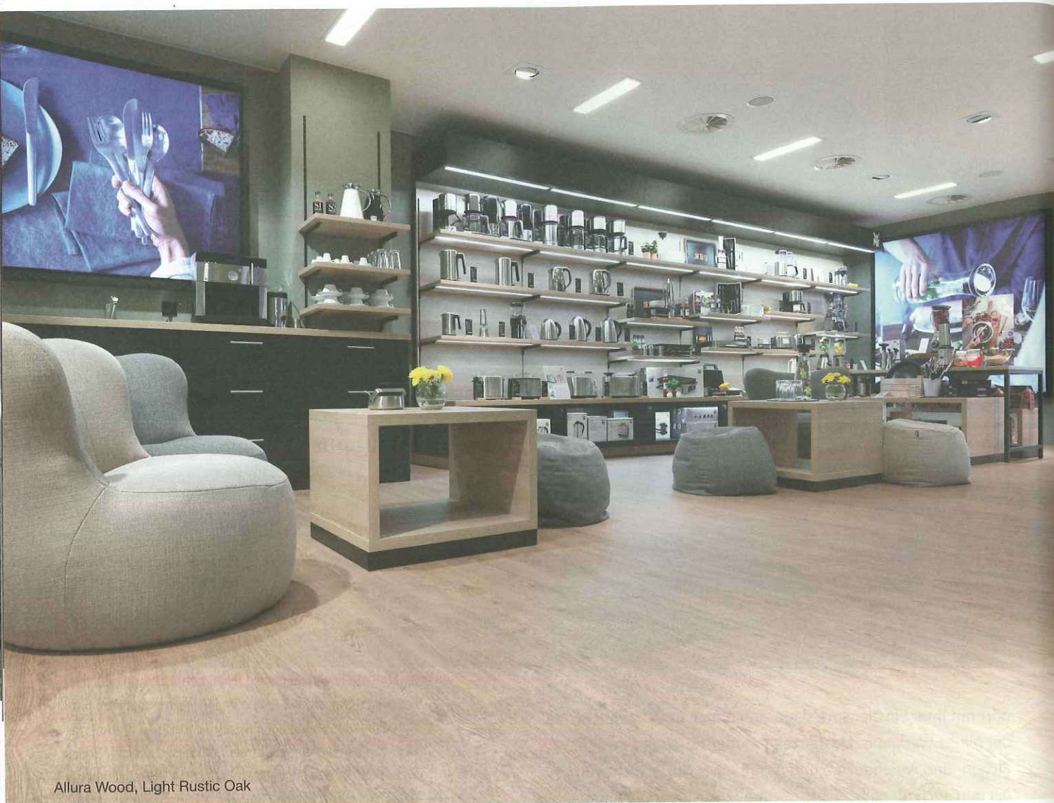
Allura Wood, Light Rustic Oak

Forbo Flooring bedient das Segment der Designbeläge mit einem vollstufigen LVT-Angebot zum Kleben, Klicken und lose Verlegen. Dazu kommt eine kunststofffreie Variante mit 35 Designs, die durch Druck- und Prägetechniken für sehr naturnahe Strukturen am Boden sorgen. „Nachwachsende Rohstoffe und der komplette Verzicht auf PVC, Weichmacher sowie Synthese-Kautschuk garantieren ein durch und durch umweltfreundliches Produkt“, heißt es aus der Zentrale in Paderborn. Alle Designböden werden in Europa entwickelt und produziert.