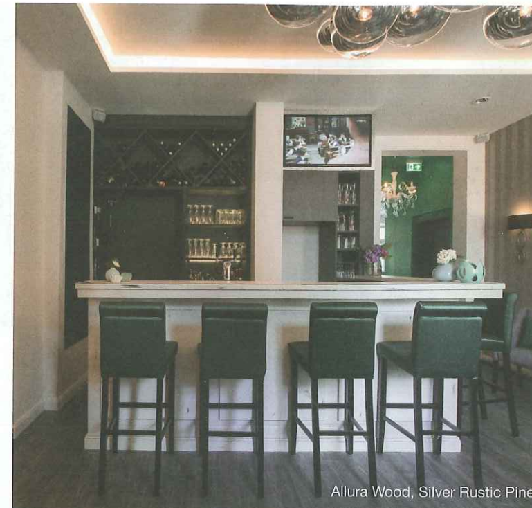
Allura Wood, Silver Rustic Pine