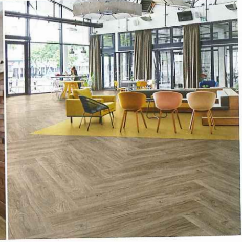
Die LVT-Kollektion »Allura | all in one« ist eine Auswahl von 238 Produktvarianten in vier verschiedenen Formaten.

stäbe in puncto Nachhaltigkeit und Wohngesundheit setzt. Alle Designböden von Forbo werden in Europa entwickelt und produziert. Sowohl die »Natürlichen Designbeläge« als auch »Allura | all in one« werden auf der »Bau« präsentiert. Auf insge-