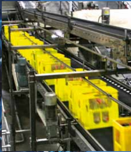
급경사에서도 무겁고 젖어 있는 제품을 무리 없이 이송할 수 있습니다.