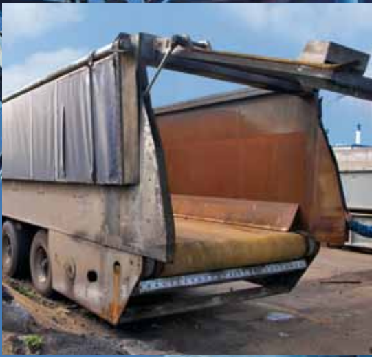
40톤에 달하는 무연탄을 하역 할 수 있으며, 컴팩트한 컨베이어 설계까지 가능합니다.