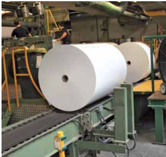
시글링 트랜스텍스는 바깥 종이의 손상 없이 1,500kg의 집중 하중을 가진 종이 제품을 처리할 수 있습니다.