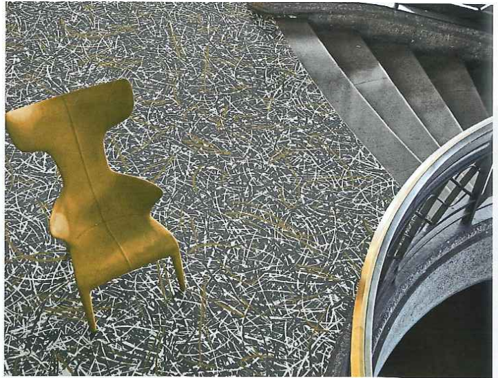
Oben Die neue Kollektion von Forbo Flooring verlässt nach Unternehmensangaben die gewohnten, traditionellen Pfade.