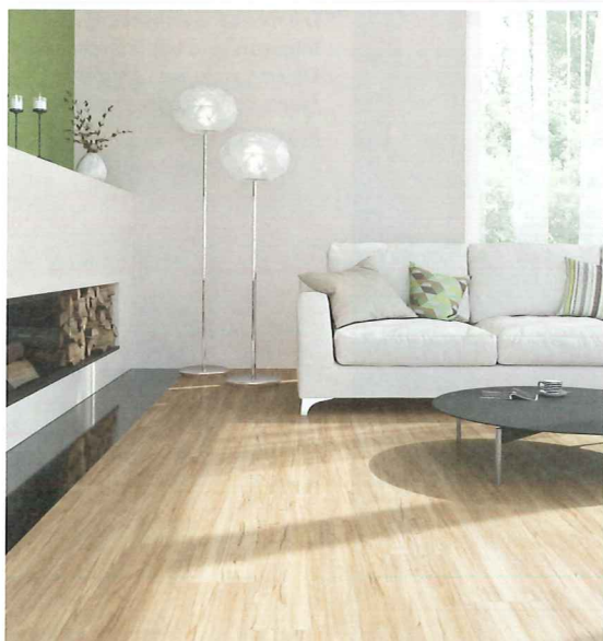
„Impressa“ sorgt mit naturinspirierten Bodenflächen für eine Raumatmosphäre mit authentischer Ausstrahlung

Optisch setzt die Produktauswahl neue Maßstäbe, denn modernste Druck- und Prägetechniken erzeugen Bodenbilder mit hoher Authentizität und natürlicher Ausstrahlung. Zwei Produktlinien zeigen die modularen Möglichkeiten in ihrer ganzen Designvielfalt. Insgesamt stehen drei verschiedene Formate zur Verfügung: „Impressa“ nimmt die charakteristischen Maserungen natürlicher Hölzer im 100 x 25 Zentimeter-Plankenformat auf. „Modular“ zeigt holzähnliche, linierte sowie geprägte Strukturen und zeitlose Beton- und Marmoroptiken – wahlweise in 50 x 50 oder 75 x 50 Zentimeter-Fliesenformaten. Zudem bietet die Oberflächenvergütung „Topshield 2“ beste Nutzungseigenschaften.