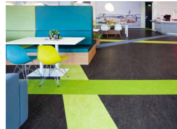
RECHTS BOVEN Tour ERDF, La Défense Sarlon Traffic