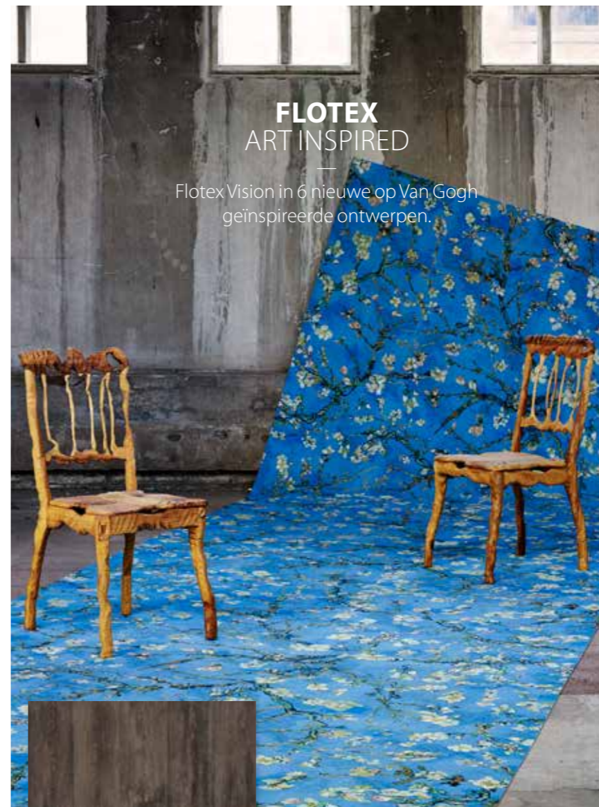
Eternal Wood 11052

Flotex Vision in 6 nieuwe op Van Gogh geïnspireerde ontwerpen.