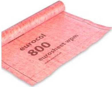
Colis 10m2 uitgerok