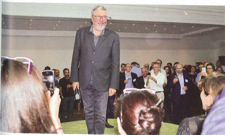
Vor rund 200 Gästen erläuterte Designer Philippe Starck in Paris die Ideen und Vorstellungen zu »Flotex by Starck«.

ken Textilbelag »Flotex«. Starcks händische Entwürfe (»Nichts ersetzt die Hand des Malers«, so der Designer) wurden mittels Digitaldruck auf die dichte Faseroberfläche des geflockten, textilen Belags aufgebracht. Et voilà: »Flotex by Starck«. Rund 200 geladene Gäste wohnten der Exklusiv-Veranstaltung in Paris bei und folgten Philippe Starcks Erläuterungen zu der kreativen Kooperation mit Forbo sowie seinen Vorstellungen von Design. Der bekannte Teppichboden-Hasser (»I hate carpets!«) belehrte sich selbst eines Besseren, indem er einen Textilbelag schuf, der alles andere als langweilig ist. Vielmehr eröffnet »Flotex by Starck« völlig neue Gestaltungsmöglichkeiten.