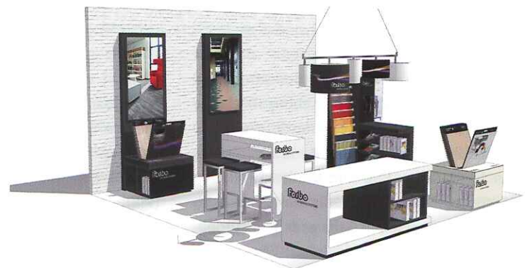
Für den PoS hat Forbo neben Kollektionsbüchern, Broschüren, Bannern und Displays auch eine komplette Shop-in-Shop-Lösung im Programm.