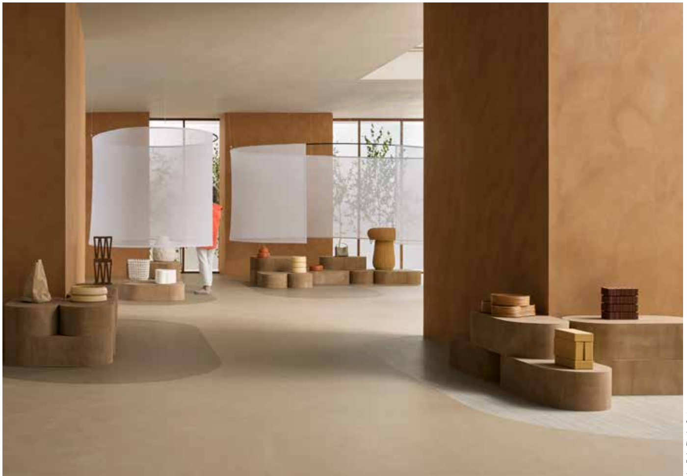
Marmoleum solid concrete drift et silt associés à Marmoleum striato rocky ice