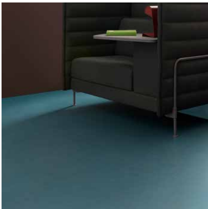
Marmoleum solid concrete Artic