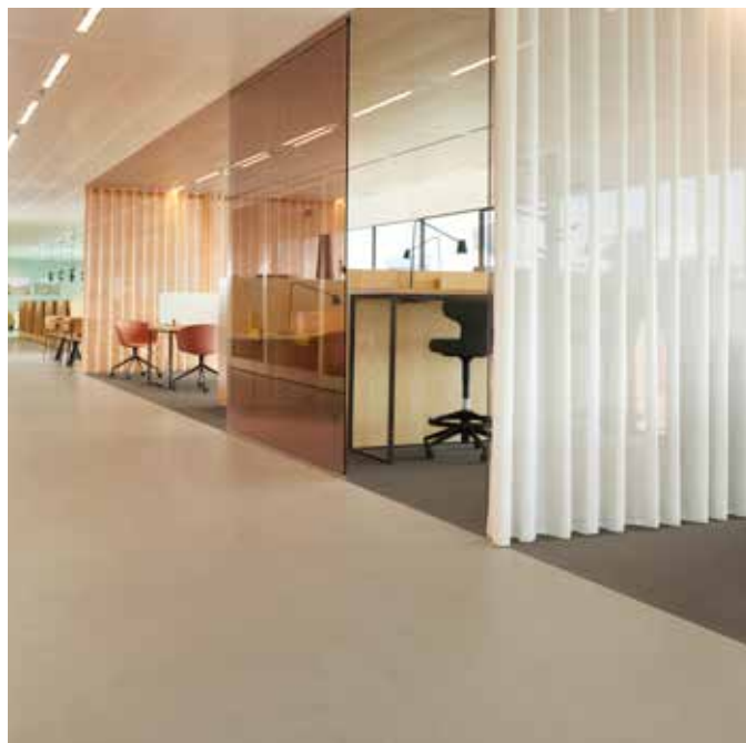
Marmoleum solid concrete pine forest