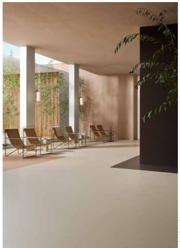
Marmoleum solid cocoa salted caramel et meringue associés à Marmoleum solid walton eggplant purple

Marmoleum solid décline 4 gammes, cocoa , walton , concrete et piano , s'adaptant à un large panel de segments (résidentiel, santé, éducation, hôtellerie, tertiaire...), alliées des zones à fort trafic. A la clé : des espaces sereins, où les personnes se déplacent, travaillent, se reposent, se divertissent et s'épanouissent.