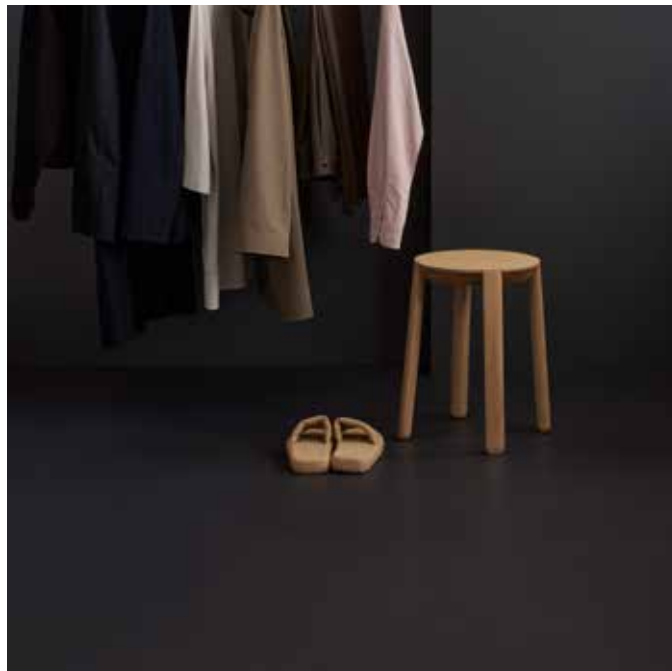
Marmoleum solid cocoa curcuma