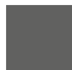
3072 Gris foncé