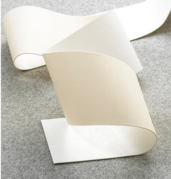
Powierzchnia (prawa strona): szorstka