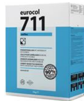
Verpakking 5 kg