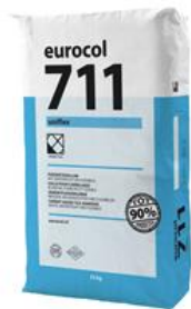
Verpakking 25 kg