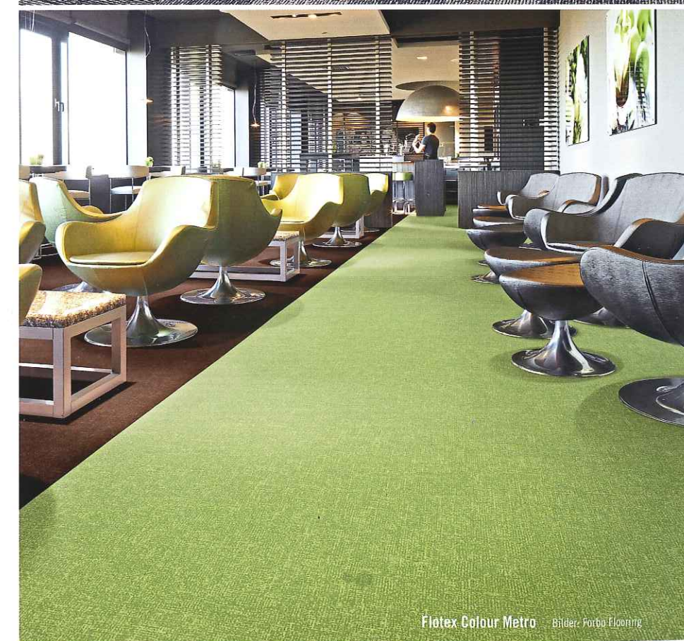
Flotex Colour Metro