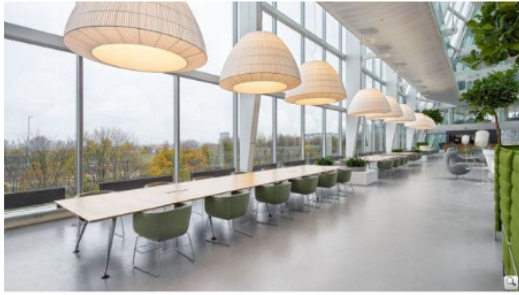
The Edge Amsterdam

Der Klimawandel stellt Wirtschaft und Gesellschaft vor große Herausforderungen, doch ein unabwendbares Schicksal ist er nicht. Vorausgesetzt es werden zielführende Lösungsansätze weiterverfolgt.