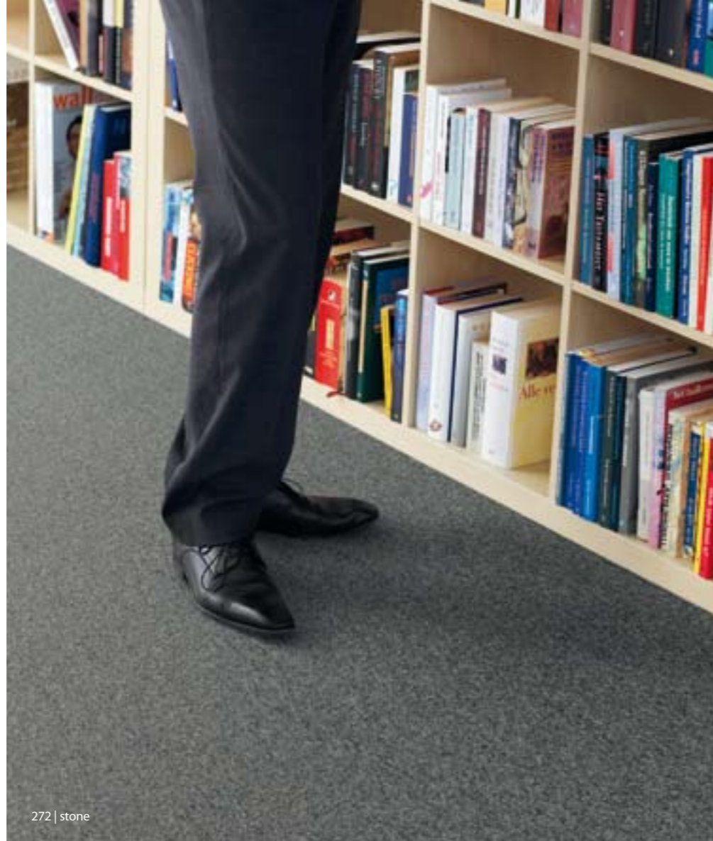
272 | stone