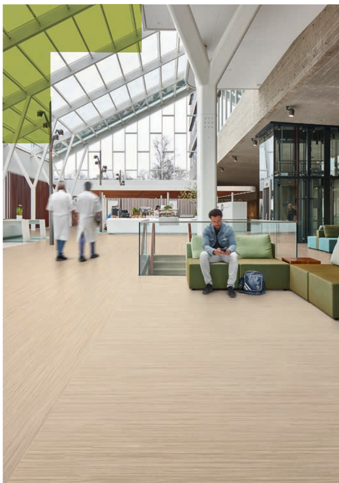
Marmoleum linear silt stone