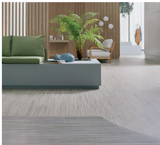
Marmoleum linear trace of nature et blue basalt

1-Disponible dans tous les décors à partir de 60 m 2