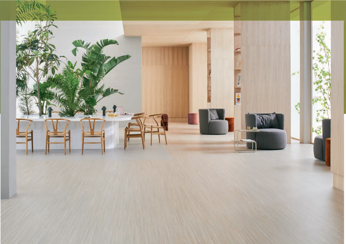
Marmoleum linear bleached gold et urban silver