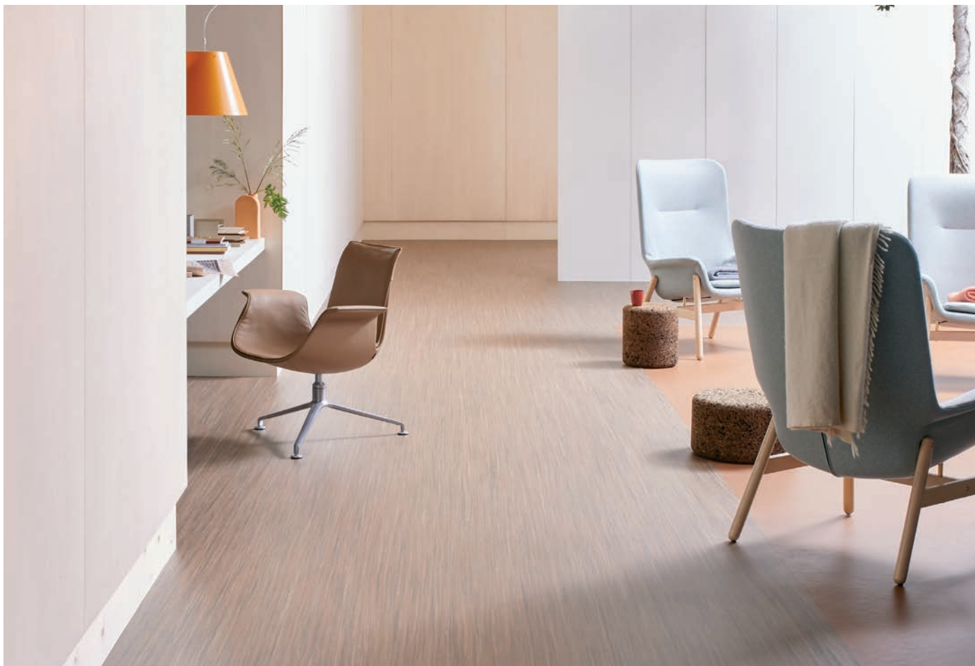
Marmoleum linear red horse et Marmoleum walton terracotta