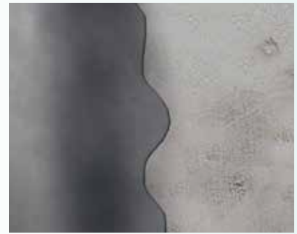
969 Europlan Reno Turbo auf Zementestrich