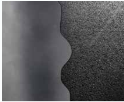
969 Europlan Reno Turbo auf Gussasphalt