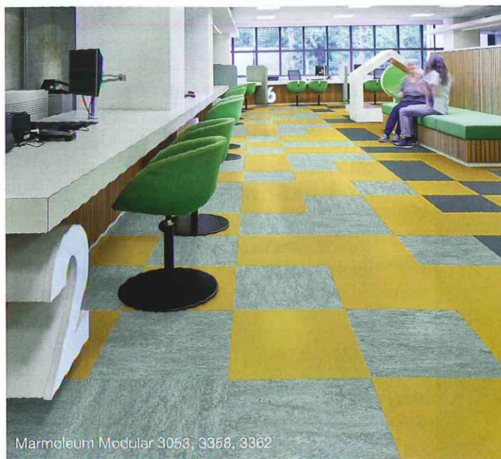
Marmoleum Modular 3053, 3358, 3362