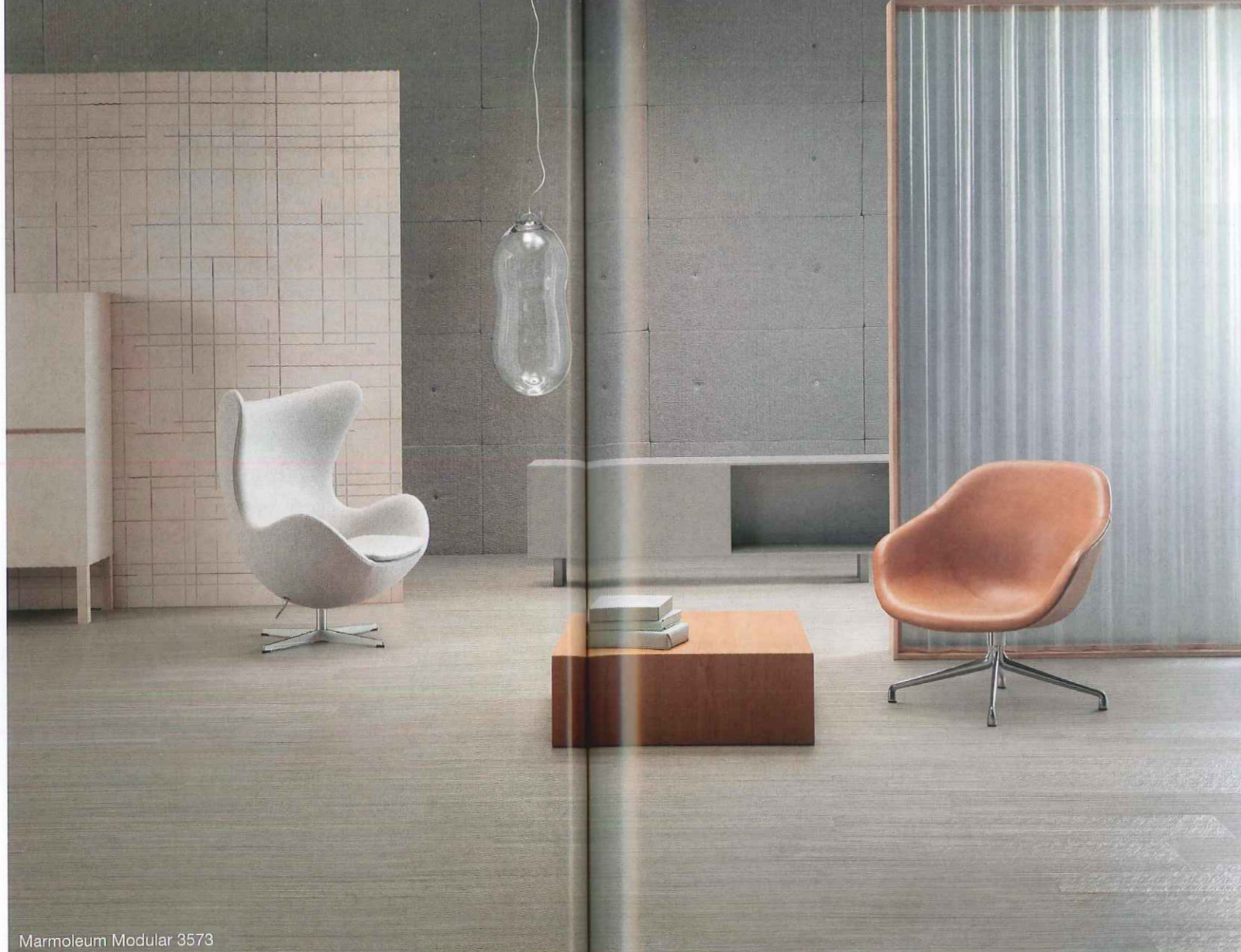
Marmoleum Modular 3573

Im Gegensatz zur Bahnenware sorgt statt des Juterückens ein Polyestervlies für die nötige Dimensionsstabilität. So lässt sich Marmoleum Modular ohne Verschweißen und mit wenig Verschnitt verlegen – und wenn nötig partiell austauschen. Wer möchte, kann die modulare Variante auch mit der Linoleum-Bahnenware kombinieren.