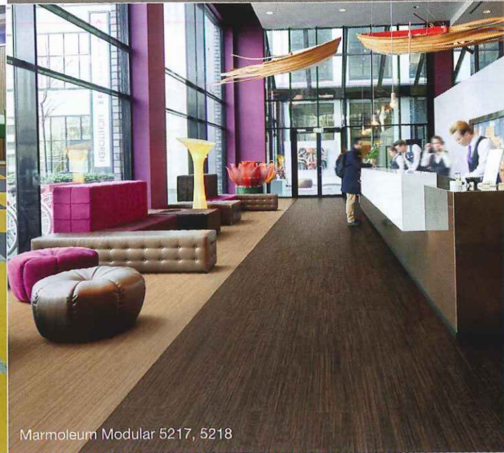
Marmoleum Modular 5217, 5218