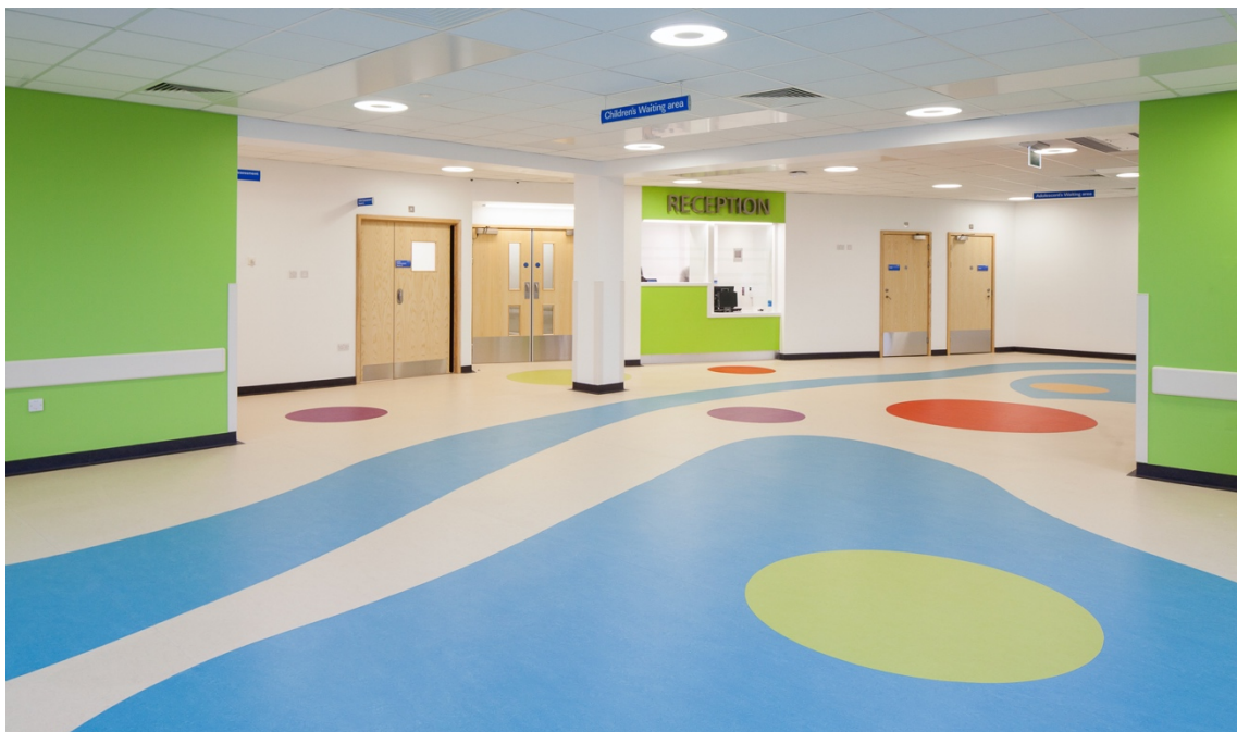
施工事例：Sunderland Royal Hospital

世界 NO.1 リノリウムメーカーのフォルボ・フロアリング B.V. (日本支店：東京都品川区/代表 宮田一隆) は、リノリウム製床材マーモリウムに抗ウイルス効果があることを、フランスの第三者機関での試験によって実証した。オランダ生まれの洗練されたカラーが魅力のマーモリウムは、病院や保育施設、介護施設など感染対策が必要な空間で、機能性とデザイン性を両立させる床材として注目を集めている。