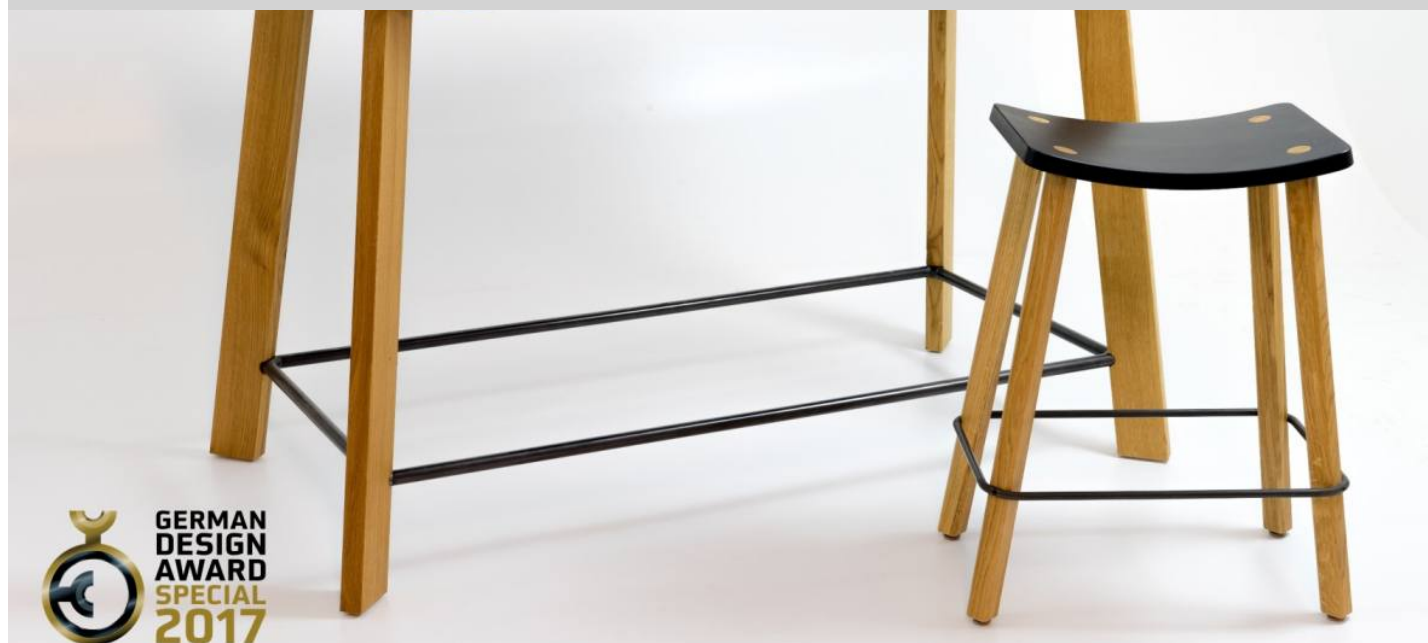
Table Angus - Allemagne

Angus est noir. Angus est une collection de tabourets et de tables de l'atelier du maître de menuisier Raphael Pozsgai. Artisanat traditionnel, matériaux durables, contemporain dans sa conception. Angus est fabriqué en petits lots à Heitersheim, au sud de Baden, au pied de la Forêt Noire. Acier dans son état original, non détartré, bois de chêne huilé, panneau de fibres de bois certifié FSC et plan de travail linoléum. La hauteur de table généreuse de 90 cm permet de s'asseoir mais aussi d'être debout. Le tableau est certifié par "German Design Award 2017 - Mention spéciale