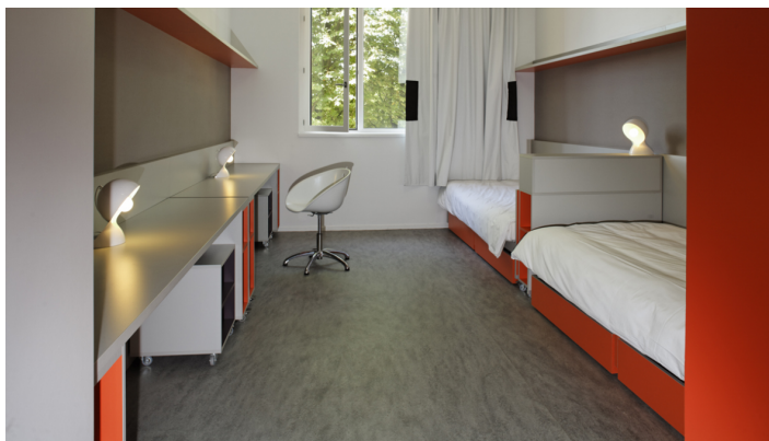
Marmoleum decibel cloudy sand