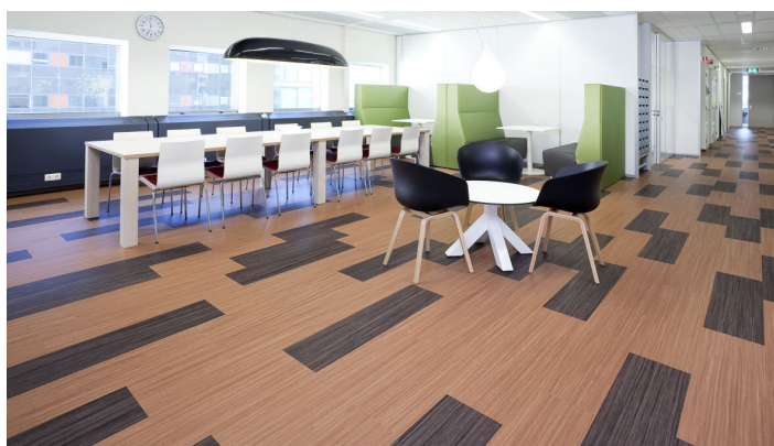
Marmoleum Modular Lines fresh walnut